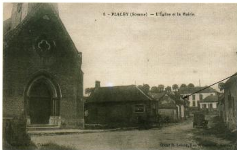
La vieille maison

Cette maison, rue du Capitaine Hémir Mézan, était sûrement une des plus anciennes du village, elle était auparavant accolée à des bâtiments, en façade, sur toute la rue.