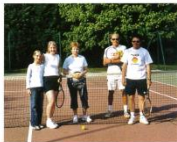
Les cours adultes au terrain de Prouzel