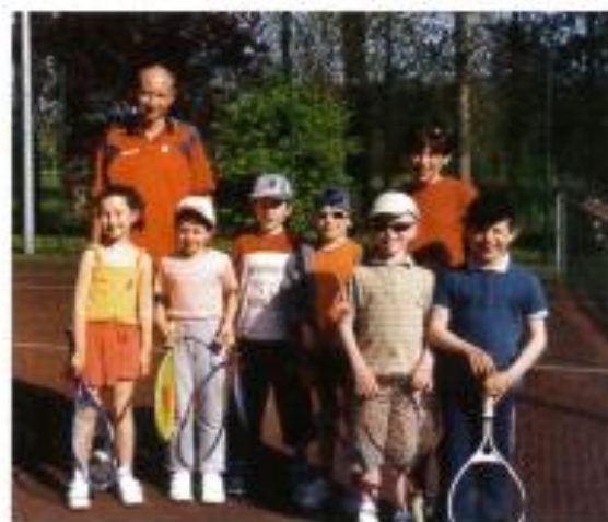
Un groupe d'enfants avec leur moniteur