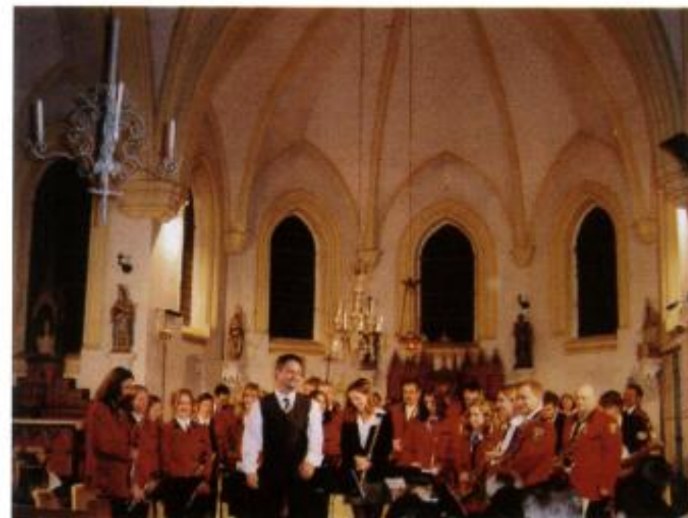
Concert de la Sainte Cécile à l'église de Plachy