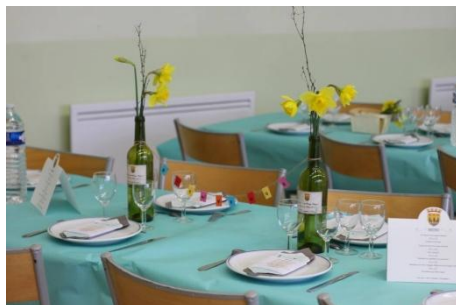
Photo: Repas des aînés du 5 mars