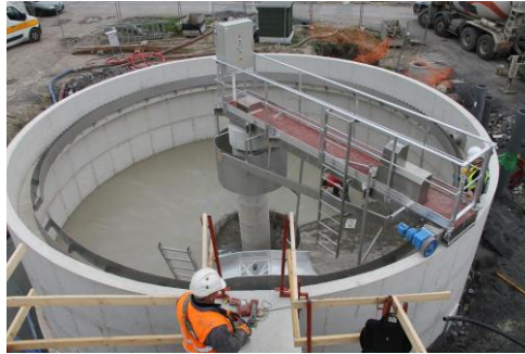
Clarificateur en cours d'équipement

Les travaux de construction de la future station d'épuration commune aux trois villages de Bacouël, Prouzel et Plachy-Buyon se poursuivent sur les parcelles acquises par le syndicat (SIAVS), route de Bacouël à PLACHY-BUYON. Si les conditions météorologiques hivernales plutôt favorables n'ont pas gêné les entreprises, la nécessité permanente de pomper l'eau issue de la nappe phréatique (500 m 3 /jour) a constitué un frein non négligeable au bon déroulement des travaux.