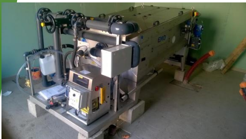
Table d'égouttage située dans le local technique

Sauf imprévu la nouvelle station devrait être opérationnelle au cours du 3 ème trimestre 2016. Dès son achèvement l'ancienne station sera détruite et les effluents transiteront par le dispositif de refoulement construit à proximité du Moulin, puis par la canalisation enfouie dans la propriété de Monsieur HURPE avant de rejoindre le nouveau réseau et la station future. Les habitations raccordées à l'ancienne station (Orée, Val de Selle, Clé des Champs, route de Beauvais...) ne nécessitent aucune modification. Seules seront concernés les immeubles situés rue de la Fontaine, rue du Cdt Dodart, place du Petit-Plachy, rue de Creuse, rue de l'Ecce Homo, rue de la gare et résidence des Peupliers. Les propriétaires ont été destinataires d'une lettre les invitant à rechercher une entreprise pour réaliser les travaux de raccordement et les informant du montant des subventions financières auxquelles ils pourront prétendre par l'Agence de l'Eau. Il leur appartient de faire établir les devis et si possible de se grouper pour obtenir le meilleur prix global.